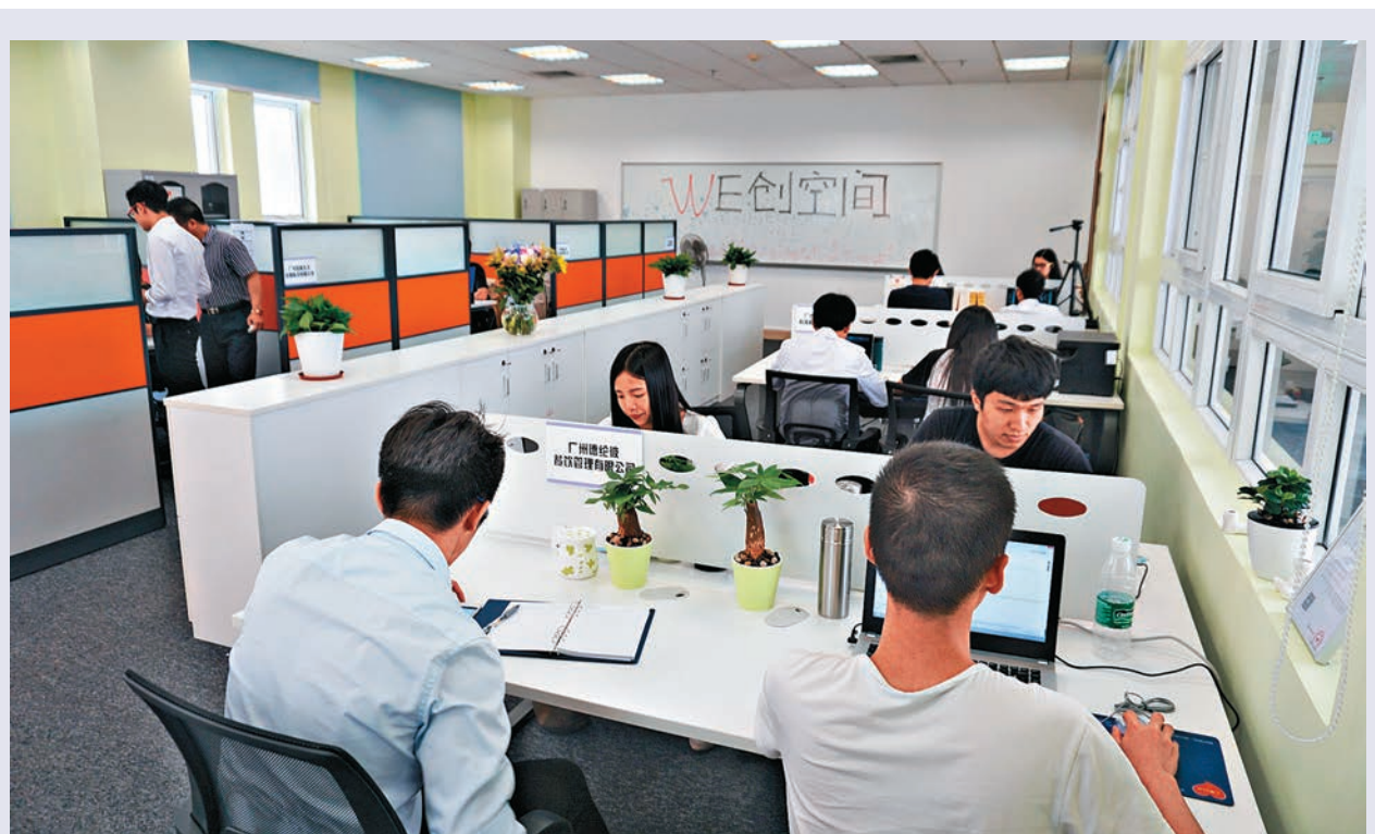
8日，第四屆廣東「雙創」大賽啓動，將加大對港澳青年優秀創新項目扶持。

此外，除省級層面，各地級市「雙創」扶持政策，港澳青年也享受同等待遇，北上創業幾乎無門檻。