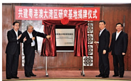
8日，粵港澳大灣區研究基地掛牌。

產業等，香港、澳門是服務業、金融中心、旅遊中心，產業之間的配套合作至關重要。對此，研究基地將進行深入研究，為大灣區發展提供智力支持。