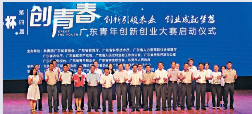
第四屆廣東青年創新創業大賽啓動現場。