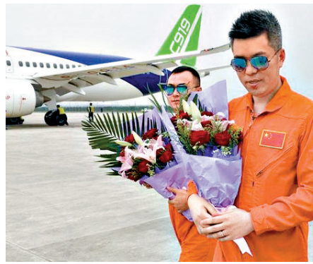
C919首飛機長蔡俊。

為此，國資委將通過建立更為全面的審計制度，對央企境外投資逐步規範到位，內容包括重點審計國有企業境外投資、合資合作等國際化經營有關決策機制的建立健全及執行情況，境外有資產財務管理制度和內部控制制度的建立和執行，境外有資產安全完整、運營效益、風險管控和保值增值等多個方面。